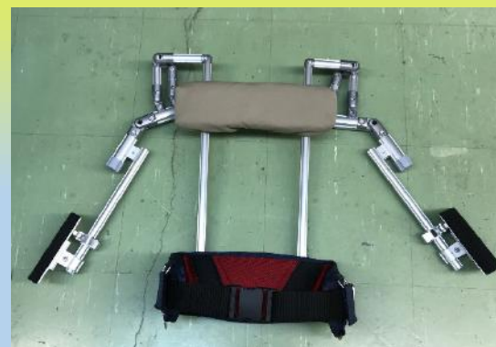
■ タイプ A