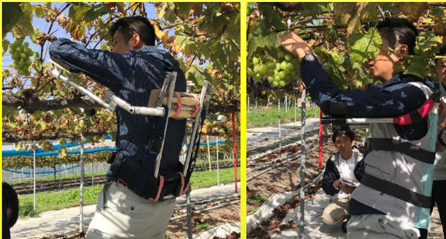
(農業技術センター 様)

改良したアームアシストを農業技術センター及び、ブドウ農家の方に装着、疑似作業を実施。