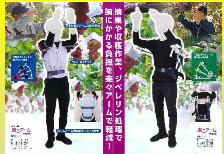
(パンフレット作製)