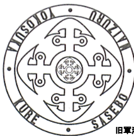
旧軍港4市シンボルマーク