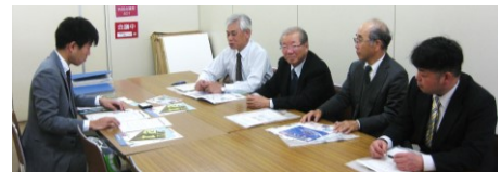
平成31年3月 視察先: 横須賀市役所スポーツ観光課

“売いたい商品”で拡販企画を実践し、 収益UPを図れる戦略を 我がグループは一緒に考えます。 ・・・ 営業開発グループへ、 是非のご参加を。