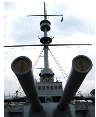
永久保存展示の戦艦“三笠”: 横須賀市