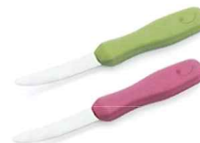
ラクピカ爪磨きラピー